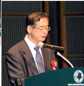
写真2 来賓挨拶をされる林文部科学審議官