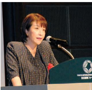
写真1 来賓挨拶をされる高市内閣府特命担当大臣