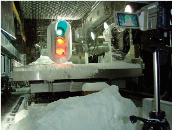
写真1 信号機の着雪実験