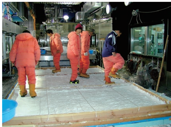
写真3 雪氷で覆われた歩道の滑り易さに関する実験

写真3 は、雪氷で覆われた歩道の滑り易さに関する実験の様子です。雪は人の足で踏み固められると、硬くなると同時に滑り易くなり、歩行者の危険が増します。この実験では、温度、日