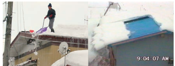
写真1 危険の多い屋根の雪 写真2 屋根雪滑落時の様子おろし作業

「屋根の雪のゆるみに注意」、「命綱の使用」、「はしごはしっかり固定」、「2人以上での作業」など(「こちら防災やまがた!」 http://www.pref.yamagata.jp/bosai/index.html )