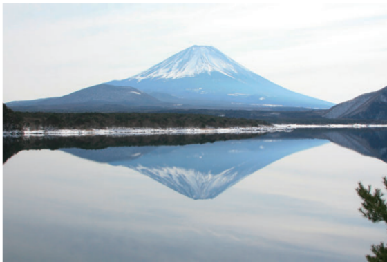
写真1 本栖湖から見た富士山

富士山が活火山であることは、多くの方がご存知だと思います。しかし、富士山の地下で体を感じない非常に小さな地震が日常的に起きていることはご存知でしょうか？ その地震の中には、普通の地震に比べて振動がゆっくりとした低周波地震という地震も含まれています。この地震が発生する仕組みは、まだ詳しくわかっていないのですが、地下のマグマの活動と関係があるらしいことがわかっています。富士山の低周波地震活動は、防災科研が高精度の火山観測を始めた1980年代頃から次第にわかってきました。現在では、高精度の火山観測は、火山防災と火山の研究にとって欠くことのできないものとなっています。この記事では、防災科研の火山観測についてご紹介します。