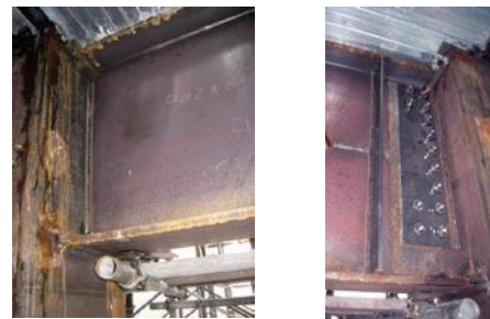
写真2 梁の根元の接合部 (左：工場溶接, 右：現場溶接)

2は試験体における柱と梁の接合部分です。柱と梁の接合部には、現場で溶接する様式と工場で溶接する様式がありますが、実験では、 写真2 に示すように、それらのディテールをできるだけ忠実に再現しました。 図1 に、設計用地震動と長周期地震動（名古屋三の丸波）の揺れが、Eーディフェンスに設置された試験体の骨組みに与えた変形角を示します。三の丸波は、東海・東南海地震を想定し名古屋で予測されている長周期地震動で、威力のあるほうに分類されます。長周期地震動を受ける超高層建物の骨組みは、設計で考えられていた変形の数倍もの大変形を