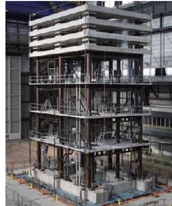
写真1 骨組の安全性に関する実験

この実験では、試験体の下層部分を鉄骨造骨組とし、その上の重量はコンクリート錘に置換しました。コンクリート錘の間に積層ゴムと鉄製ダンパーを挟むことで、超高層建物の揺れを発生させました。 写真1 がその試験体になります。重量は、Eーディフェンスの限界である1200tにあと数パーセントです。ここで、建物を構成する骨組みの大切な部分を考えてみましょう。木の枝にぶら下がって力をかけて揺さぶると、枝が根元から折れます。骨組みの中でも、梁の根元に大きな力がかかります。設計では、大地震時にここが簡単には折れず粘りながら耐える、と想定しています。しかし、その一番大きな力がかかる部分に柱と梁のつなぎ目（接合部）があり、問題を難しくします。 写真