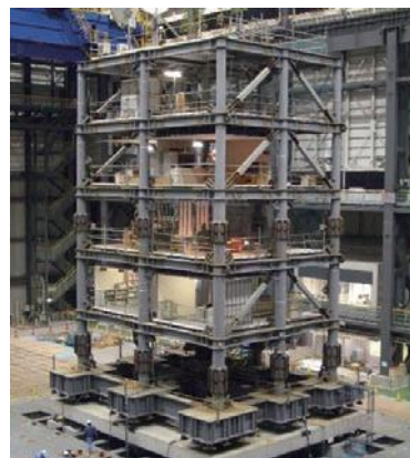
写真3 室内の安全性に関する実験

住宅やオフィスを忠実に再現し、そこに対策した場合と、対策していない場合のシナリオを用意して、高層階の揺れを与えました。写真4