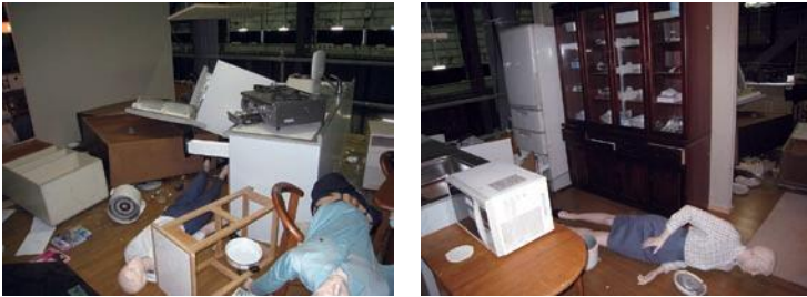
写真5 キッチン (左: 対策なし, 右: 対策あり)

と写真5は、被害と対策の効果の様子です。オフィスには、収納能力の高い(背の高い)書棚等があり、対策のための固定が無ければ、転倒は免れません。床の大きな揺れによって、キャスター付きの家具や器機は大きく移動します。コピー機のように200 kgにおよぶ重量物が、3m以上の揺れ幅で、3分間以上動き回り、壁に穴を開ける状況も記録されました。当然、このような揺れの中で人間は立っていることが出来ません。重量物が衝突してくる時に、そこにいる人々は伏せている状態であり、無防備に上半身で受けてしまうのです。移動式書棚などの扱いもあり、オフィスの重量物に対する対策は、専門家との相談が必要でしょう。まずは、レイアウトを考え、ものを置く場所と働く場所を適切に区分し、被害を最小限にとどめる工夫が必要です。