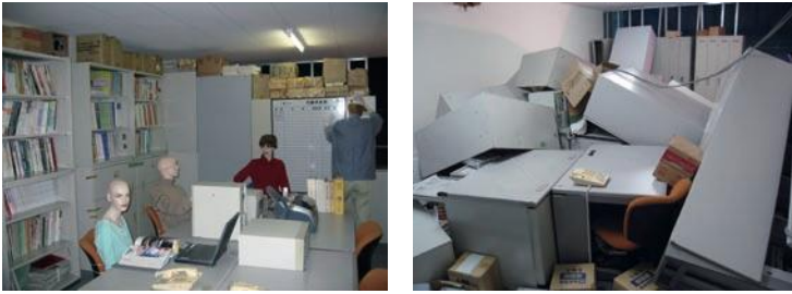
写真4 オフィス (左: 加振前, 右: 加振後)