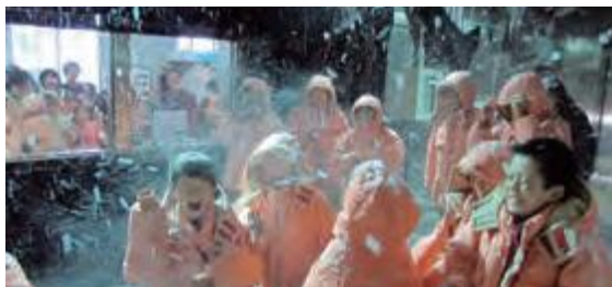
雪氷防災実験棟での吹雪体験

雪氷防災実験棟の氷点下10℃の大型低温室では、3階の高さから降ってくる人工雪の結晶観察や、吹雪体験(写真)に子供たちは歓声をあ