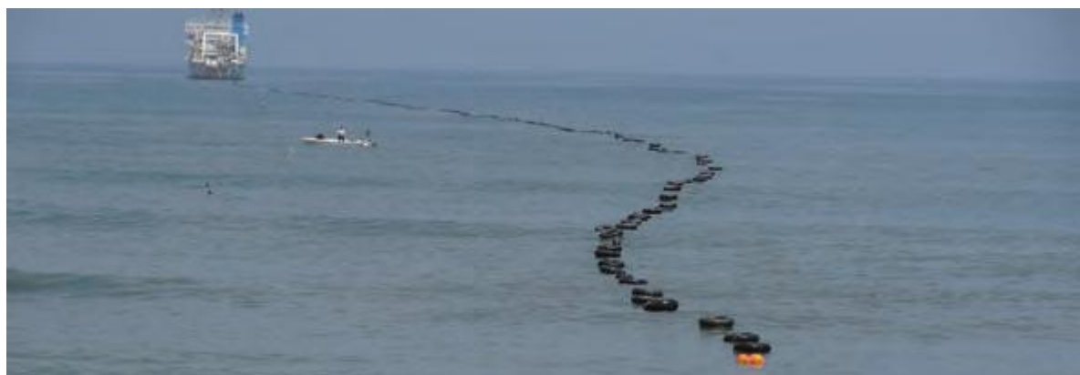
鹿島沖での陸揚げ作業の様子

を行い、平成27年度から本格運用を開始する予定です。この観測網により地震と津波のリアルタイム・連続観測・監視が可能となり、精度が高く迅速な津波警報や地震速報の高度化への貢献が期待されます。