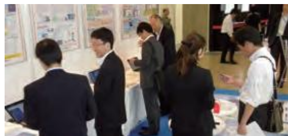
賑わう防災科研のブース

ブースを訪れた自治体関係者などの来場者からは質問が絶えず、防災科研に対する関心の高さが窺えました。