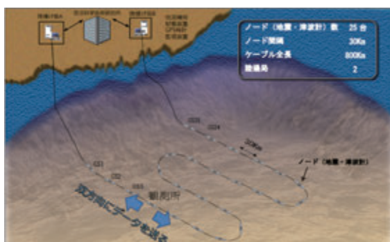
図2 海底に設置するひとつの観測網の俯瞰図

日本海溝海底地震津波観測網は、①房総沖、②茨城・福島沖、③宮城・岩手沖、④岩手・青森沖、⑤釧路・青森沖、⑥海溝軸外側の観測網に分かれています。それぞれの海域に設置する観測システムは約800 kmの光海底ケーブルと約25台の地震津波計で構成していて、ケーブル上30 km間隔に地震津波計を挿入しています。この一連の紐状の観測システムを沿岸と海溝軸の間で折り返して設置することによって、東西方向約30 km間隔、南北方向に約50 km間隔の格子状の観測網を海底に構築します。