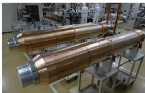
図3 地震津波計の内部の模式図と外観