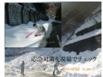
図2 雪崩危険個所点検と応急対策（山梨県2/25）

今後は今回の調査結果を踏まえ、南岸低気圧による大雪災害低減のためにもさらに研究開発を進めていく予定です。