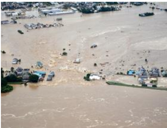
常総市内の破堤による浸水 (10日午後5時頃、鬼怒川左岸から常総市内方向に撮影)

査です。京都大学防災研 3) や東京大学 4) も同様な調査をしており、それらの結果も合わせて図1に示しました。この地域は鬼怒川と小貝川に挟まれた低平地で、市の北部から南部に向かって緩やかな勾配となっており、東西方向には、鬼怒川と小貝川沿いの住宅付近の標高が高く、市の中央部が低くなっている地形特性のため、浸水範囲は常総市の洪水ハザードマップとよく一致しています。