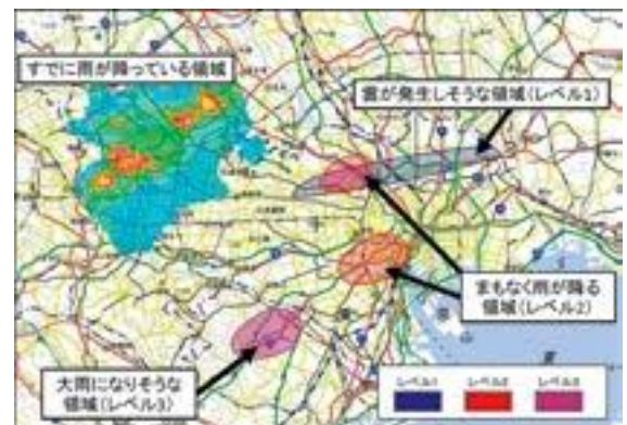
図1 積乱雲早期予測のイメージ（背景は地理院地図）

に、XバンドMPレーダの高度利用による降雹検知技術の開発や、雷予測技術の開発を進めていきます。