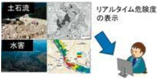
図2 土石流・浸水危険度伝達システムのイメージ