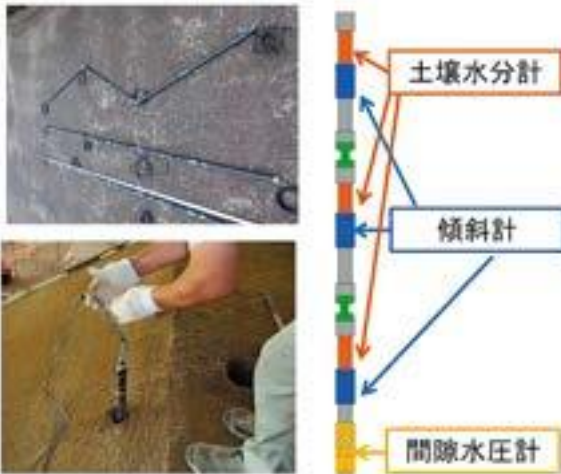
図3 斜面の水分状態および動きを検出するジョイント型マルチセンサー

平成26年広島豪雨で、土石流のきっかけとなったのは斜面の崩壊です。このような斜面崩壊を早期検知するセンサーの開発を進めています(図3)。このセンサーは土壌水分計、傾斜計、間隙水圧計を組み合わせたジョイント型のマルチセンサーで、土中の水分状態と斜面の動きを同時に検出できることが特徴です。私たちは大型降雨実験施設等を活用して、センサーの高度化を図っています。