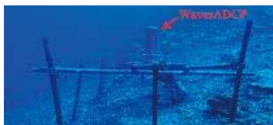
写真1 波・流れの観測装置WavesADCP設置の様子

私たちは、地球温暖化時の強大台風に匹敵する台風15号下の波・流れの観測データの取得に成功しました。今後は、観測地点を増やし、さらに詳細なデータを取得したいと考えています。また、西表島は、2006年に最大瞬間風速69.9m/sの台風13号（SHANSHAN）が来襲するなど、本研究で観測された台風より強い台風が来襲した歴史があります。そのため、西表島網取湾において継続した台風下の波・流れの観測を行い、地球温暖化時に予測されている強大台風にさらに近い条件での観測データ取得を目指します。