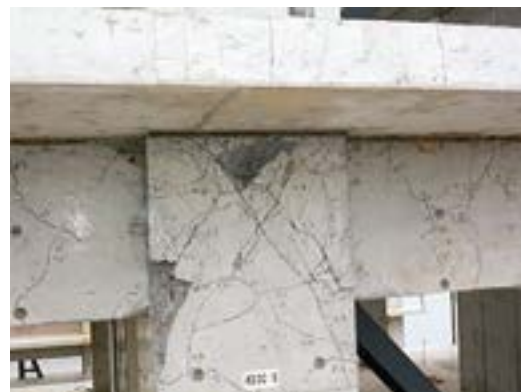
図4 耐震実験時の構造物損傷（柱梁接合部）