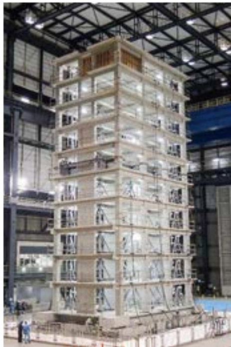
図1 10階建て鉄筋コンクリート造建物試験体

次に比較のため、試験体基礎梁を震動台に固 定した基礎固定状態での振動台実験も実施しま した。