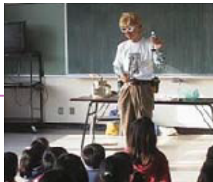
ドクター・ナダレンジャーの実験教室 釧路市立旭小学校にて

皆さん、“エッキー”ってなんだか知っていますか？ これは、地盤の液状化現象をペットボトルの中に再現する実験道具です。それを発明した研究者を今回はご紹介します。いろいろな科学イベントに怪しいいでたちで出没、ドクター・ナダレンジャーと名乗っているおじさんです。子供から大人まで、幅広い層に人気ですよ。研究者といえば、難しい顔をして難しい言葉を操るちょっと取っつきにくい人というイメージがありますが、本当はどうなのでしょう。ドクター・ナダレンジャーの素顔に迫ってみました。