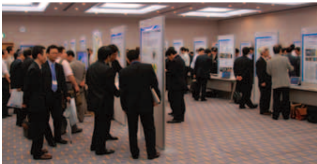
ポスター展示会場の様子

の豪雨災害の発生予測を目指して」「雪害を減らす」「災害に強い社会システムの形成に向けて」「基盤的地震観測網を活用した地震活動の評価」「地震ハザード評価手法の開発」「E-ディフェンスを活用した耐震工学研究」「自治体のための災害対応情報システムの開発」という8テーマでそれぞれ講演をしました。