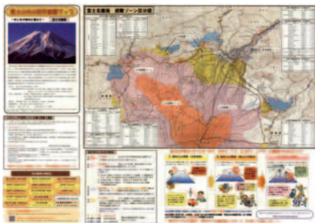
図1：ハザードマップの一例