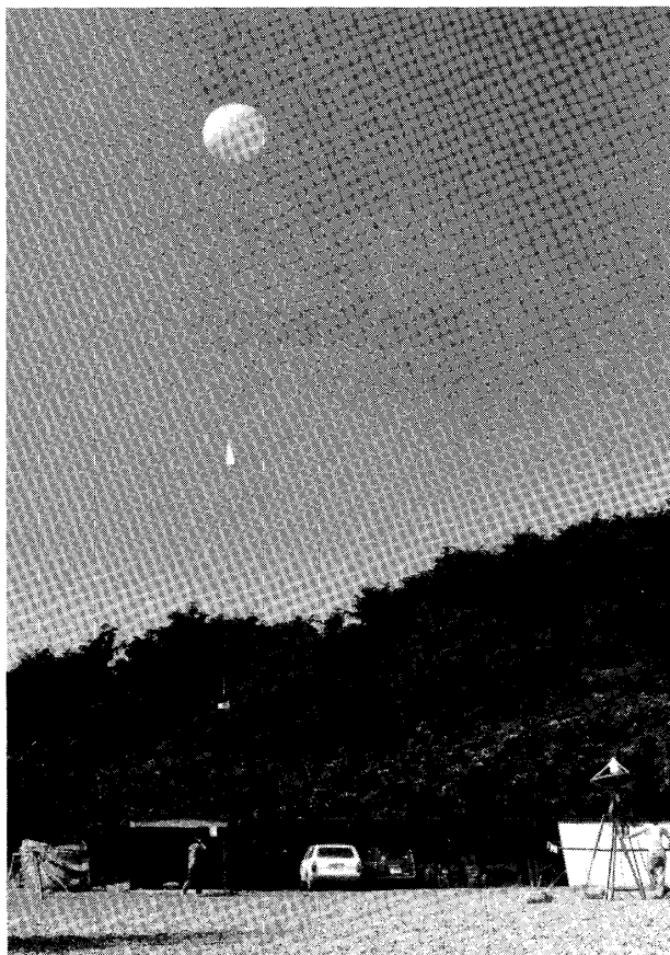
写真 1 観測風景

究室長)の二つの特別研究の一環として、 降ひょう予測手法の開発、積乱雲構造の 研究等のため、レーウィンゾンデによる 高層気象観測が、群馬県藤岡市において 実施された。実施期間は、昭和45年10 月8日から14日、昭和46年6月11 日から19日、昭和47年6月14日か ら23日、および7月27日から8月2 日、昭和49年7月30日から8月7日、 昭和50年7月30日から8月5日、な らびに昭和51年6月2日から9日であ る。これらの期間中計135回の観測が 行なわれた。これらの観測資料はヨウ化 銀散布機による降ひょう抑制予備実験、 気象レーダーによる積乱雲観測など、主 として野外実験・野外観測現場での作業 計画決定に使用されるとともに、「関東