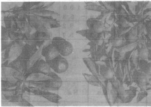
試料/61 (普通温州ミカン) 左：干害小 右：干害大