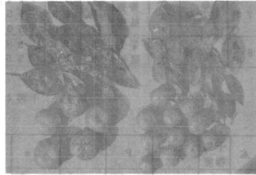
試料/67 (普通温州ミカン) 左：干害小 右：干害大