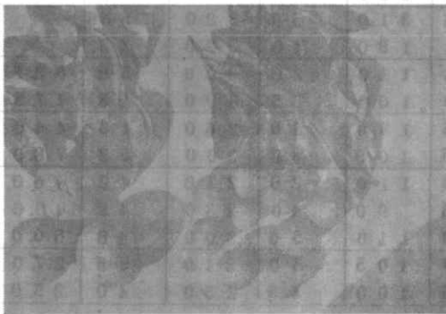
試料/66 (夏ミカン) 左：干害小 右：干害大