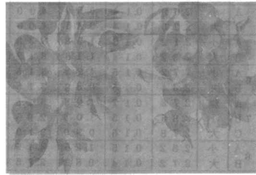
試料/64 (夏ミカン) 左：干害小 右：干害大