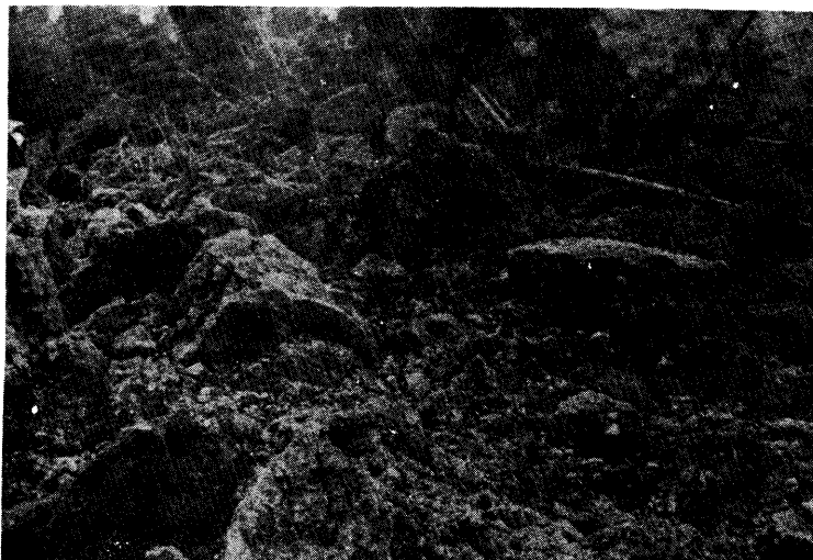
写真-7 和奈出沢のすべり土塊とスギの木