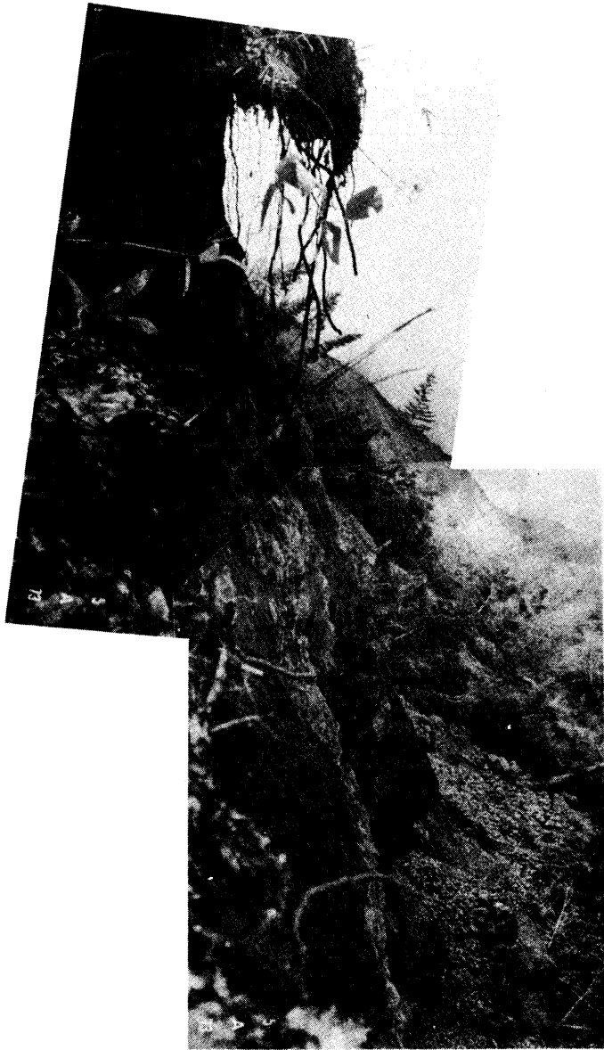
写真-3 最上部滑落崖（基岩露出状況）