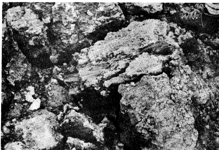
写真-8 すべり土塊中に散見される埋没古木