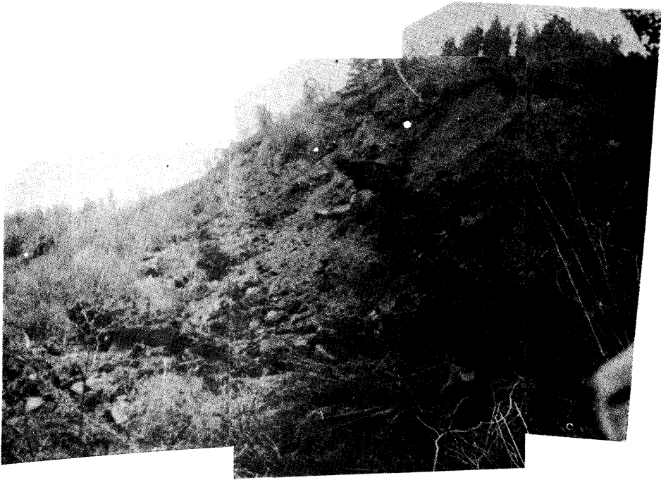
写真-4 和奈出沢上流側部の滑落状況