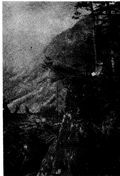
写真-2 最上部の亀裂（滑落後の現在も残っている）