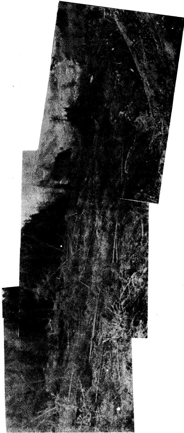
写真-6 和奈出沢中流部の地すべり状況（スギとカラマツが多く倒れている）