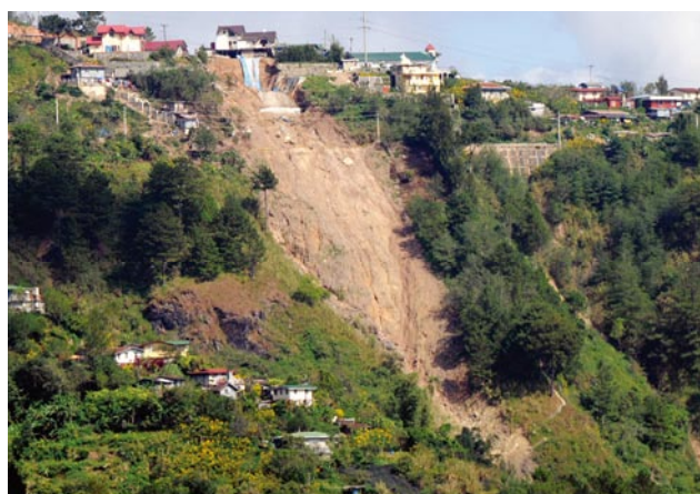
写真7 Yapdue 付近の土砂崩れの発生状況 Photo 7 Landslide in Yapdue area.

土砂崩れの発生現場はバギオ市庁舎から僅か 500 m 程しか離れていない市の中心部に近い住宅街で(図1)、道路からの眺望は極めて良く、高台の様な様相を呈している場所の直下である。崩れたのは道路のすぐ直下の急斜面で、最大幅は約 20 m、崩壊斜面長は約 25 m、勾配 30 数度である(写真5)。周囲の状況と入手した地形図から判断して、元の地形は谷の源頭部に相当していたと思われる。断定はできないが、崩壊斜面の上部を通る道路を造成する際に、谷の一部を盛土した可能性が考えられる。崩れた斜面側の道路脇には側溝などの排水施設は設けられておらず、傾斜している道路面を伝わって周囲に降った雨水が斜面に流れこんだことが誘因として作用した可能性も考えられる。