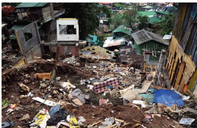
写真4 Cresencia Village の土砂崩れによる住宅密集斜面における被災状況 Photo 4 Damage of houses along the slope due to the landslide in Cresencia Village.