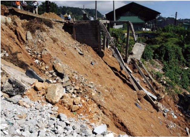
写真1 Kitmaの土砂崩れ現場。ここにあった住家は斜面下に崩れ落ちた。