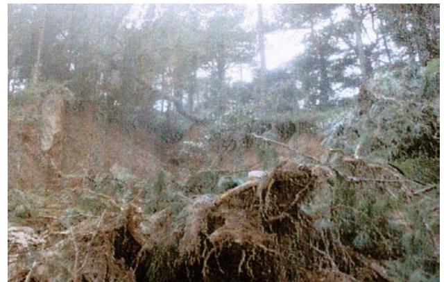
写真3 PNB Ville 地すべりの発生直後の状況

この場所が開発された詳細な経緯については不明な点もあるが、豪雨の際には崩れる危険性のある山地斜面の安全性について考慮せずに、無秩序に住宅を建てたことも被害を大きくした要因として指摘できる。