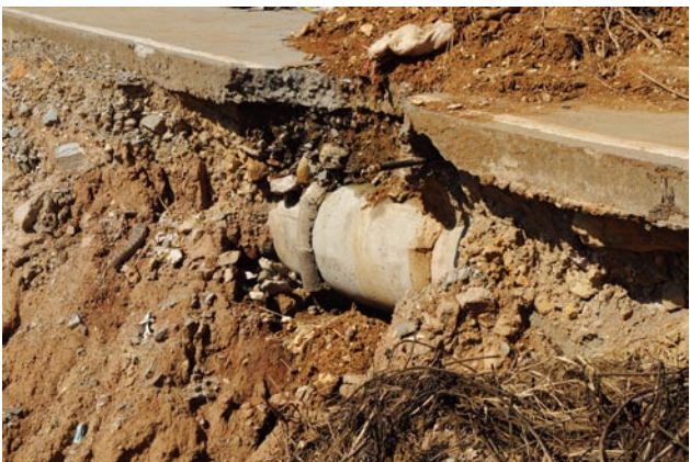
写真2 Kitmaの土砂崩れ上部に埋積された下水管

道路面に降った降水をどのように処理しているのかに関しての調査を行なう時間が取れなかったが、調査範囲では排水管以外には他に原因らしいものが見当たらないため、路肩部分に埋設されていた排水管からの漏水が原