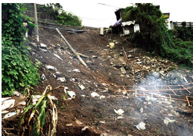
写真5 Cresencia Village で起きた土砂崩れの発生斜面の状況 Photo 5 Condition of the slope where landslide occurred in Cresencia Village.