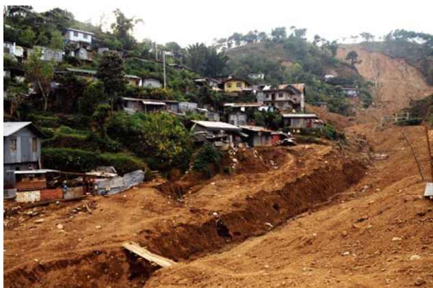
写真10 リトルキブガン地すべりで被災した谷沿いに建てられていた住宅の被災状況