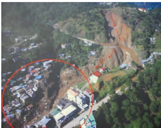
写真8 リトルキブングン地すべりの発生状況 Photo 8 Landslide in Little Kibungan.

この地すべりで崩れ落ちた大量の土砂は直下の谷の中に流入し、数100m下流まで高速で流下して大きな被害を引き起こす結果となった。この谷の両側には沿って住家が立ち並ぶ集落となっており、流路に近い場所にあった住家は流失もしくは全壊した。調査時点ではかなり復旧工事が進められていたため、被災当時の状況はあまり残されていないが、写真10によって高速地すべりが通過した流路と住宅地の立地状況の関係を見ることができる。