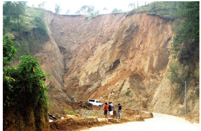
写真9 リトルキブングン地すべりの崩壊源の状況 Photo 9 Origin of landslide in Little Kibungan.

地すべりが発生したのは道路に直接面した高さ約25mの急な斜面である(写真9)。なだらかな頂部を持つ丘陵状の小ピークの稜線に近い部分からえぐられたように崩れ落ちている。この地すべりの発生規模は幅約30m、奥行き約35mである。地すべり発生域の右側方崖はこの斜面を斜めに切っていた断層面を境としており、楔形の形状で崩れている。地すべりの上部はほとんど稜線に達しており、発生域の背後にはほとんど集水域がない状況である。そのため崩れた斜面部分に降った大量の雨が地中に浸透して発生したものと推測される。浸透した雨水が断層面に遮られてその上の土層に集中した可能性が考えられる。