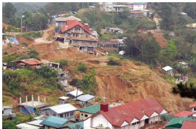
写真6 Pinsao Proper で起きた地すべりの発生状況 Photo 6 Landslide in Pinsao Proper.