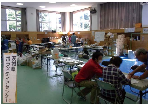
図 3 茨城県災害ボランティアセンター Fig. 3 Ibaraki Prefecture volunteer center.