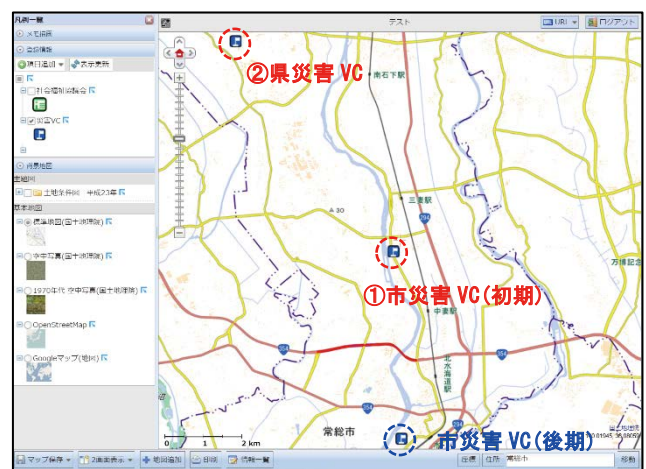
図 1 災害ボランティアセンター位置図

常総市社会福祉協議会（以下：社協）と茨城県による災害 VC が 2 カ所に開設されたこともこの災害における特徴であり、市社協は三妻地区の三妻学童クラブ建屋内（図 1 の①）に、県は県立の石下総合体育館内（図 1 の②）に設置された。