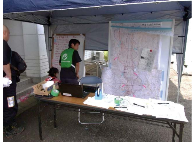
図 11 市災害 VC での案内地図掲示・閲覧(VC 入口) Fig. 11 Posting and browsing a guide map at Josho City disaster VC (entrance).