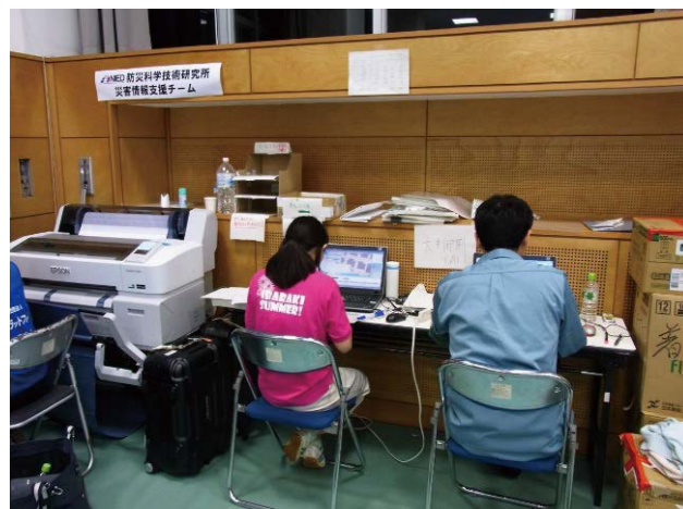
図8 ニーズ情報入力作業(県災害VC)

Fig. 7 Input of need information (Joso City disaster VC).