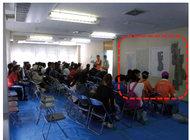
図 13 市災害 VC での地図掲示・閲覧(ボランティア待機所) Fig. 13 Posting and browsing a map at Josho City disaster VC.