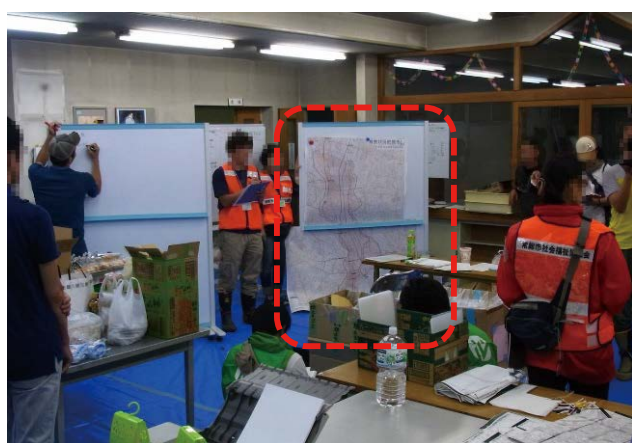
図 15 災害 VC の活動計画に利用(運営スタッフ) Fig. 15 Collected information is used for a disaster VC's activity plan (operation staff).