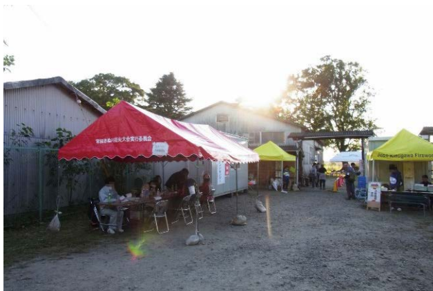
図 4 常総市災害ボランティアセンター(後期) Fig. 4 Joso City volunteer center (later period).

本報告では、筆者らのチームがこれまで研究開発を行ってきた災害情報を共有するためのツール(李ほか, 2011; 田口ほか, 2015; 水井ほか, 2015; 田口ほか, 2016)について、被災地における災害 VC での活用効果検証について述べることを目的としている。