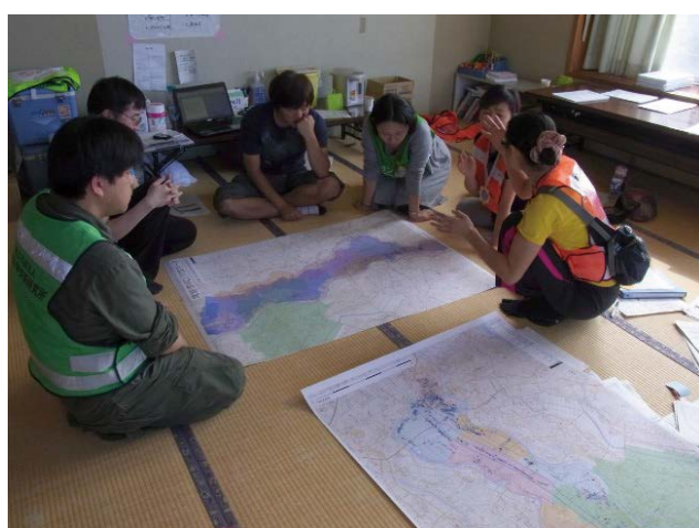
図 16 災害 VC の活動計画に利用(運営スタッフ) Fig. 16 Collected information is used for a disaster VC's activity plan (operation staff).