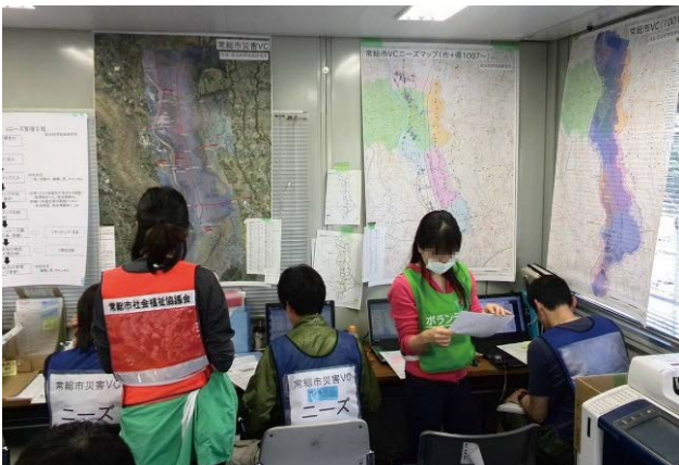
図 10 県+市災害 VC 融合データを掲示・閲覧 Fig. 10 Posting and browsing integrated data of Ibaraki Prefecture and Josho City disaster VCs.

電話受付チーム、情報入力チーム、ニーズ班の被災者に関する情報共有が可能となり、問い合わせに迅速・丁寧に対応することが可能となった。