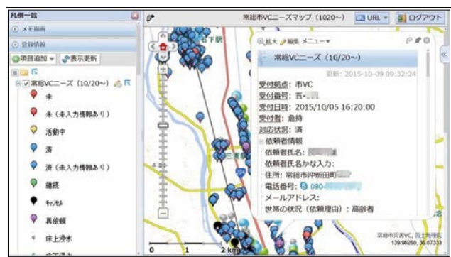
図6 ボランティアニーズ情報表示(11/20時点) *赤色ピン新規ニーズ、青色ピン活動済み

Fig. 6 Display of information on volunteer needs (as of Nov. 20).