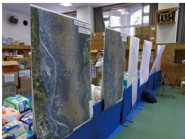
図 14 県災害 VC での地図掲示・閲覧 Fig. 14 Posting and browsing a map at Ibaraki Prefecture disaster VC.