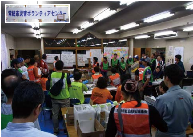
図 2 常総市災害ボランティアセンター(初期) Fig. 2 Joso City volunteer center.