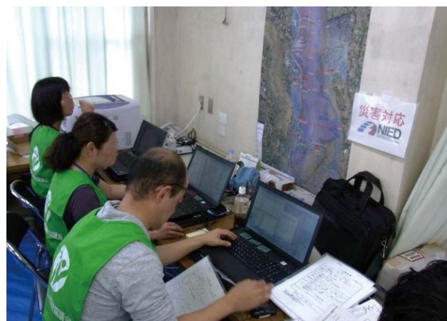
図7 ニーズ情報入力作業(市災害VC)

ボランティアニーズの情報管理と活動状況把握(作業状態・内容・被災者の健康など)を行うために、災害VCでは「ニーズ情報入力」、「ニーズ情報のデータベース構築」、「活動場所のマッピング表示」を実施した(図7、図8)。