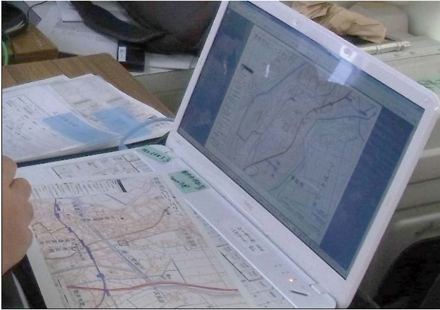
図 9 活動場所への案内地図(ニーズマップ) Fig. 9 Guide map to activity sites (Needs map).