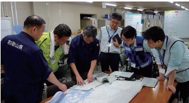
写真 2 広島県庁での災害対応 Photo 2 Disaster response at Hiroshima Pref Gov.

支援要員の業務は、被害報のような紙資料のデータ化や、個々の市町村の Web サイトで公開される給水所等の情報を毎日クローリングする作業と、現地の災害対策本部においては、地図作成申込みの記録などの事務作業であった。