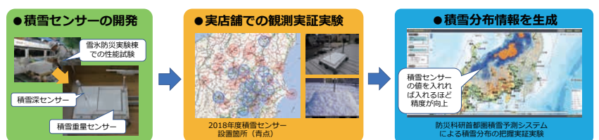
図2 新たに生成した積雪分布情報