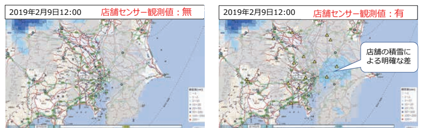
図3 2019年2月9日の積雪分布事例 (左：気象庁メソ気象モデルのみ、a右：セブン・イレブンに設置したセンサーの値を追加)